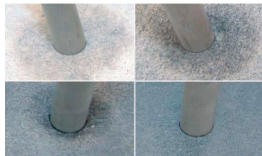
Ölspuren auf der Oberfläche nach 144 h bei Raumtemperatur

Typische Anwendungen der CALCAST® CC 155 G4, G8 und G16 sind Transfer- und Transportrinnen, Gießlöffel und Gießtröge, sowie Heißkopfringe und Übergangsplatten.