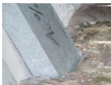
Benetzung in Flüssigaluminium